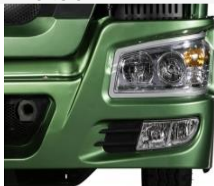
Đèn Halogen kép kết hợp đèn sương mù