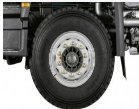
Lốp xe 12.00R20/ 12.00R20 (20 bố)