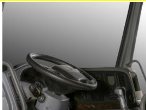
Tay lái gập gù