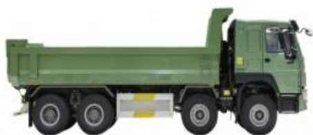
Thùng ben bằng thép siêu cường