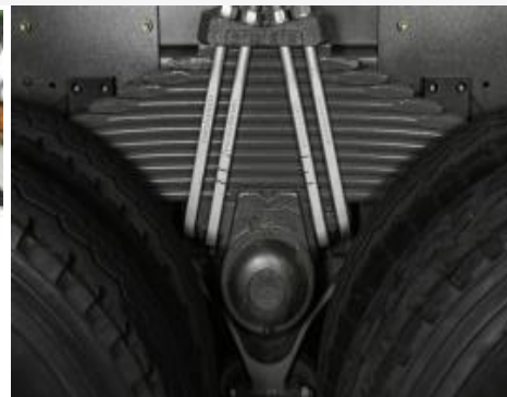
Hệ thống treo phụ thuộc, nhíp lá (12 lá), giảm chấn thủy lực