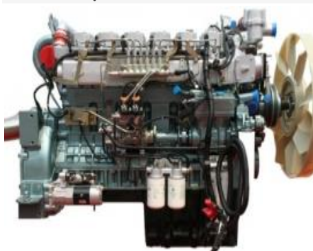
Động cơ SINOTRUK /D10.38-40