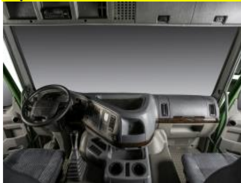
Cabin rộng rãi, hiện đại