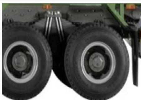
Cầu chủ động - cầu dầu ST16