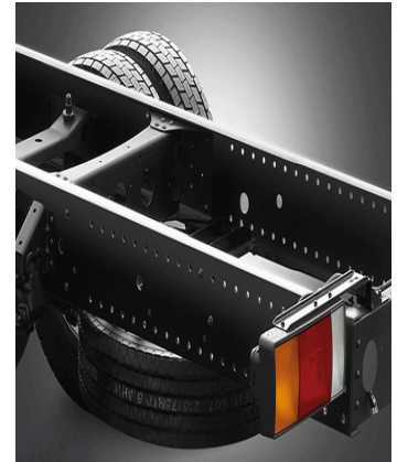
Khung sắt xi siêu cứng

Khung thép dày, hấp thụ xung lực, đảm bảo an toàn